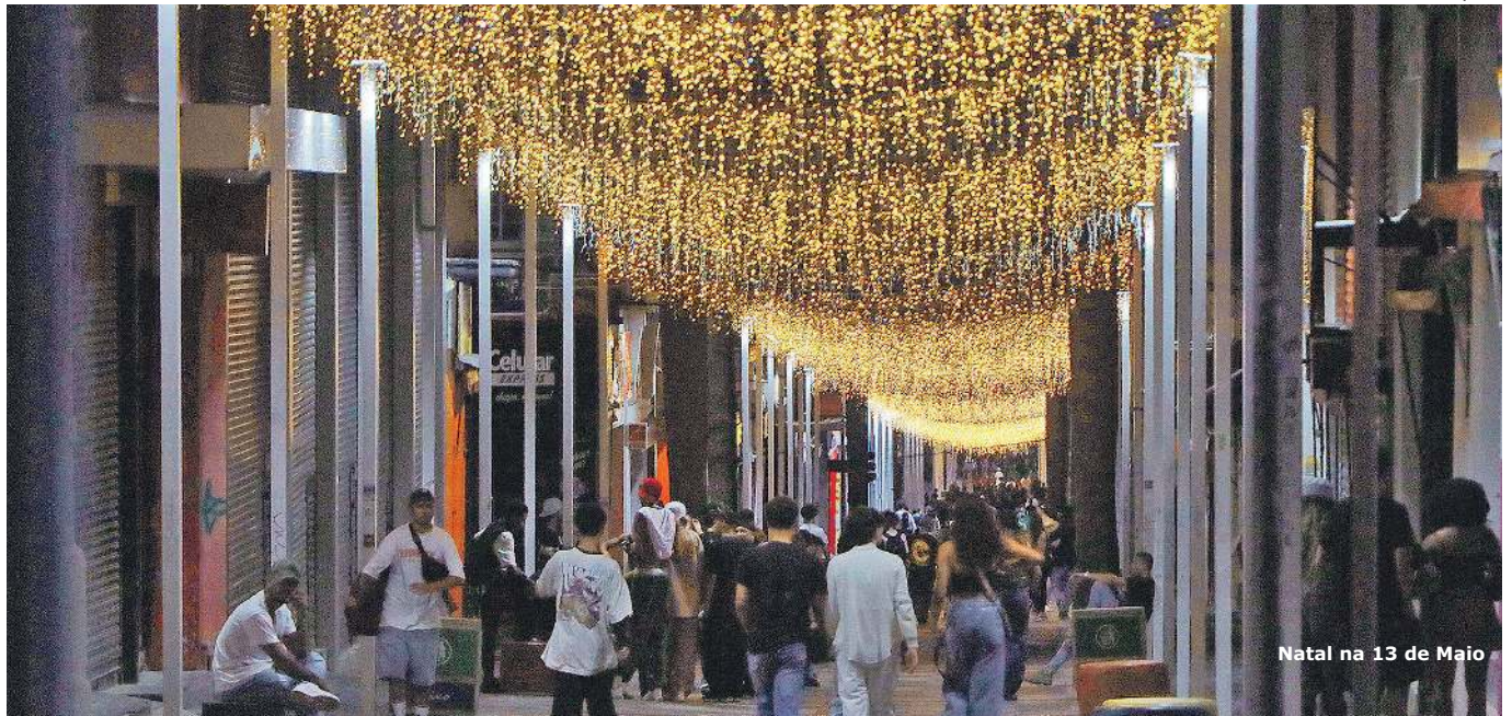
Natal na 13 de Maio